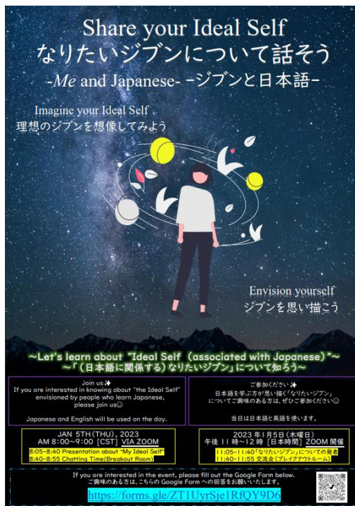
図1 オンラインイベントの告知ポスター

イベントの広報は、自身のInstagramのアカウントを使用して24時間限定の投稿ができるストーリー機能を用いて発信したり、自身の知り合いに直接連絡したりしました。